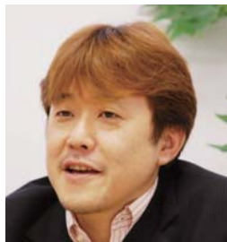
株式会社ゼロワン 代表取締役専務

管理の効率化のために、株式会社ゼロワンでは、個人向けセキュリティ製品からの脱却が避けて通れない課題として意識されるようになってきた。